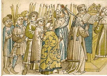
Der Papst betet die Weihnachtsmesse im Konstanzer Münster.

Höhepunkt des nächtlichen Gottesdienstes war wohl der Moment, als König Sigismund auf die Kanzel ging, um die weihnachtliche Frohe Botschaft, wie sie heute noch gelesen wird, zu verkünden. Otto Beck verarbeitet diese Gegebenheit in dem Buch „ Konzil-Weihnacht “ liebevoll und lässt erahnen, was für eine besondere Weihnacht die Konstanzer 1414 erleben durften.