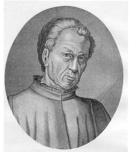
Der Humanist Poggio Braccolini war ein großer Liebhaber antiker Schriften und stöberte in den Bibliotheken der Region nach verloren geglaubten Schätzen.

„Die Sonne strahlte wie reines Feuer aus dem blauen Himmel herab.“ Im Oktober 1415 erzählt er in seinem Brief von den Feierlichkeiten anlässlich der Rückkehr von Kaiser Sigismund nach Konstanz: „Große Pferderennen, verschiedenartige Fechtspiele und andere Attraktionen füllten den Tag. Bis in die späten Abendstunden ertönte dieser Lärm in allen Straßen, wie der Wasserfall des Rheins vor den Toren der Stadt. Überall wo man hinschaute sah man farbenprächtige Leuchter. Jung und Alt tummelten sich feierlich gekleidet in den Straßen“.